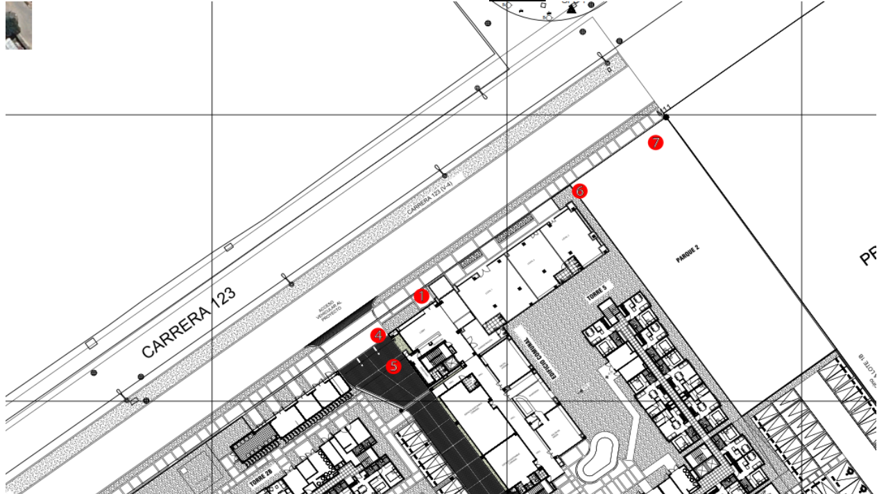
Imagen No.2. Mapa de localización general de los árboles proyecto, aportado por el solicitante mediante radicado SDA 2025ER85601 del 23/04/2025.